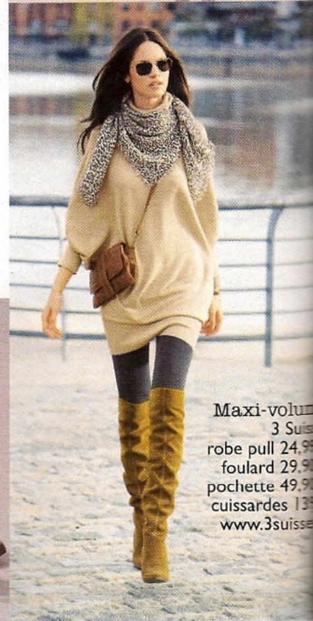
Maxi-volume 3 Suisse, robe pull 24,99 €, foulard 29,90 €, pochette 49,90 €, cuissardes 139 €, www.3suisse.com