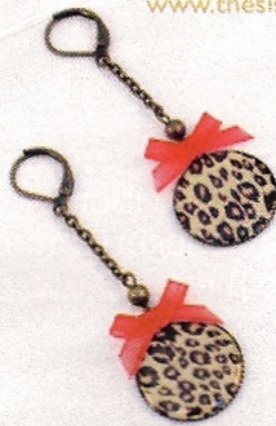
Boucles léopard The Sisters, boucles d'oreilles 18 €, www.thesisters-lesite.com