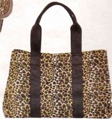
Sac sauvage Rue Princesse, sac Pop Couture Variation Tote Fantasy 65 €, www.sarenza.com