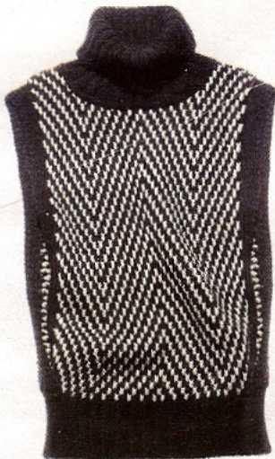
Pull jacquard Benetton, Pull 49,90 €, www.benetton.com