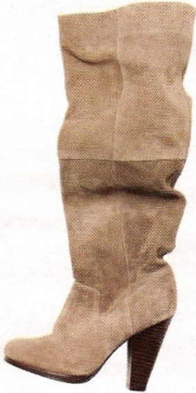
Haut perchée H&M, bottes hautes en cuir et daim 99 €, www.hm.com