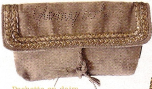
Pochette en daim A.Némi, trousse Glamy Color 45 €, www.a-nemi.moonfruit.fr