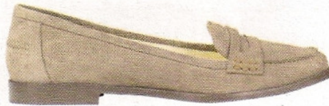
Mes mocassins en nubuck San Marina, mocassins Gervita 65 €, www.sanmarina.fr